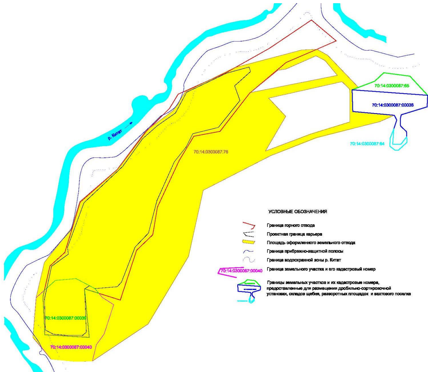
СХЕМА РАСПОЛОЖЕНИЯ ЗЕМЕЛЬНЫХ УЧАСТКОВ, НЕОБХОДИМЫХ ДЛЯ РАЗРАБОТКИ БАРАНЦЕВСКОГО МЕСТОРОЖДЕНИЯ СТРОИТЕЛЬНОГО КАМНЯ